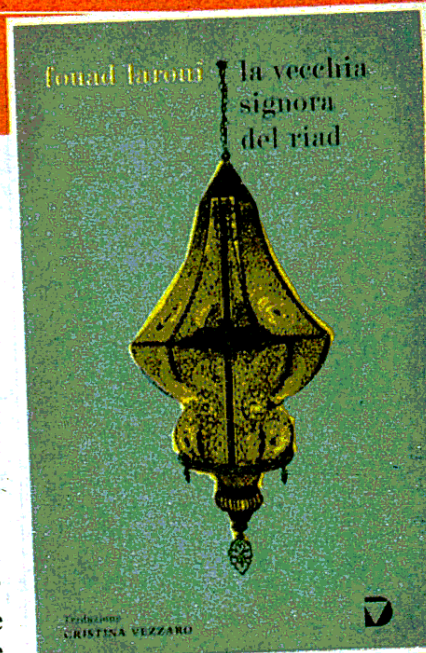
Fouad Laroui LA VECCHIA SIGNORA DEL RIAD Del Vecchio, 222 pagine, 18 €

Se ne innamorano subito, lo acquistano e si trasferiscono lì. Ma la prima sera scoprono qualcosa che li sconcerta. In una stanza, al buio, seduta su una sedia, c'è una donna vecchissima, che non parla e se ne sta lì immobile. Chi è? E da dove arriva? Ironico e divertente, il romanzo mette in luce tutte le spaccature prodotte dalla tormentata storia intercorsa tra i due Paesi.