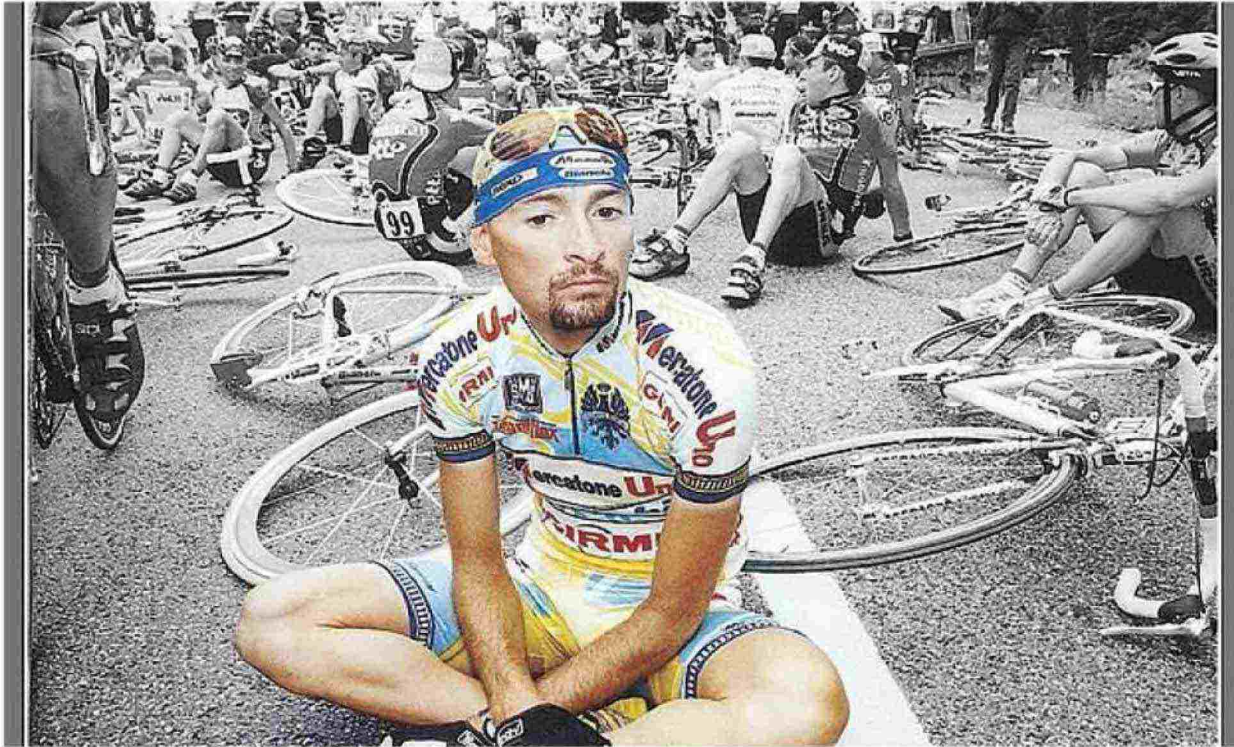
Sopra e sotto alcune immagini dello spettacolo 'Pantani' per la regia di Marco Martinelli ed Ermanna Montanari