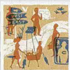
Sherwood Kiraly Pesci poeti e cari ricordi

Sorrisi e sentimenti con le immagini del baseball che fu