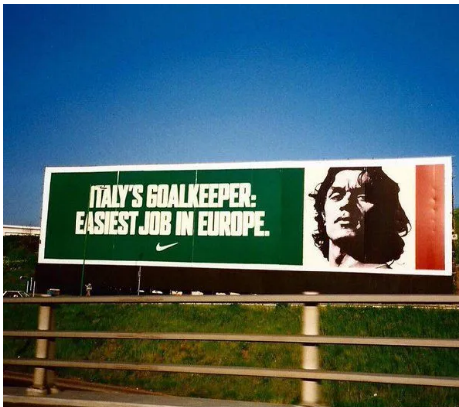
La pubblicità della Nike in vista di Euro 96 con Maldini protagonista