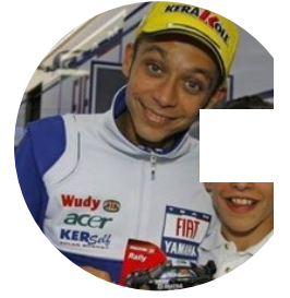
Valentino Rossi: respinto il ricorso