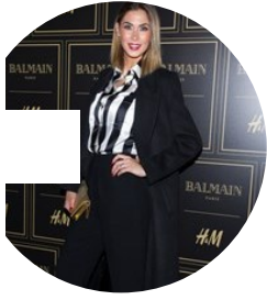
Balmain: party a Milano