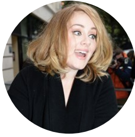
Adele tra figlio e fidanzato